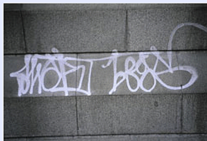
De 'Goudse stadsregels':

Je ziet op deze en op de vorige pagina twee lijstjes met regels. Eén lijst komt uit Zuid-Afrika, de tweede is opgesteld door de inwoners van Gouda. Alle inwoners mochten een lijstje maken met de tien belangrijkste regels om het leven in Gouda veiliger, schoner en aangener te maken. Stel je moet zelf een lijst met 10 regels opstellen om het leven op school in goede banen te leiden. Welke regels zouden op jouw lijst staan?